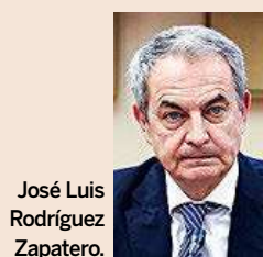
José Luis Rodríguez Zapatero.

Stellantis invertirá 60.000 millones y mantendrá sus catorce marcas P12