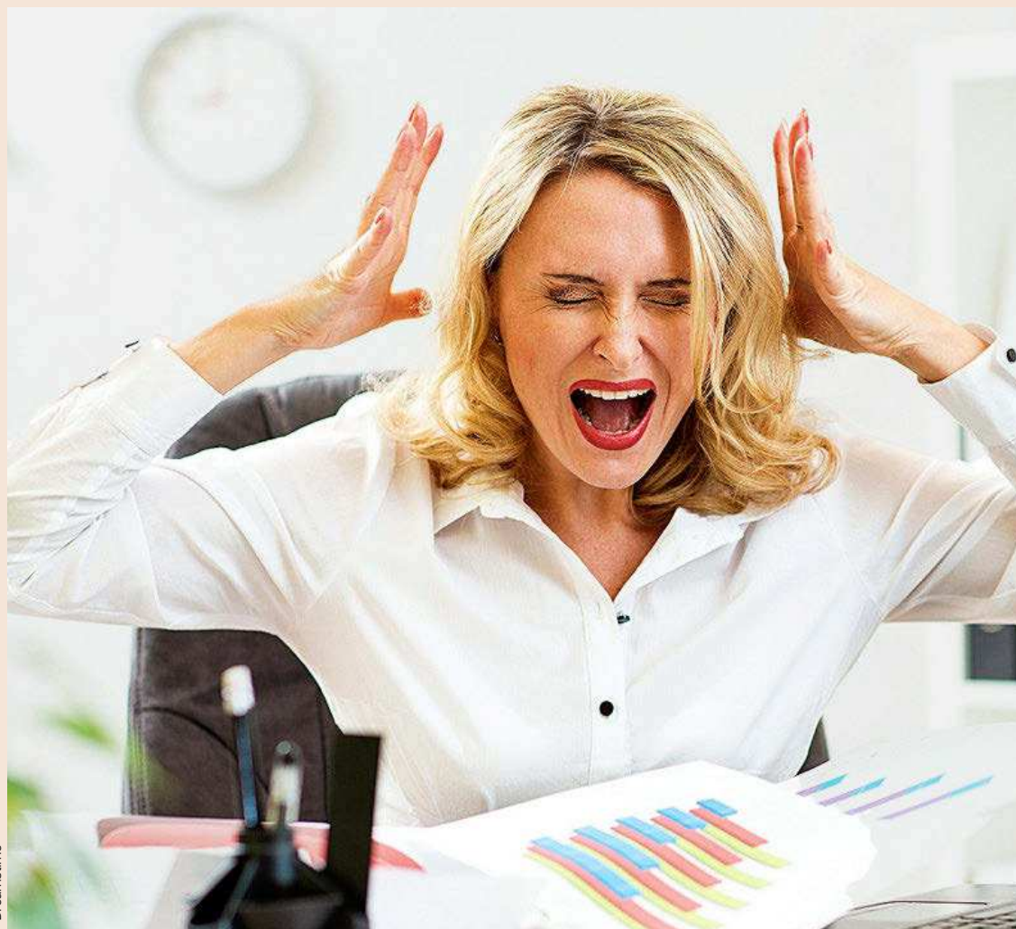
El cortisol elevado mantenido en el tiempo favorece que las líneas de expresión se marquen más y que ciertas arrugas terminen haciéndose permanentes. Además, el bruxismo es una manifestación muy frecuente del estrés constante.

A la larga, “también acelera procesos relacionados con el envejecimiento cutáneo”, señala el dermatólogo