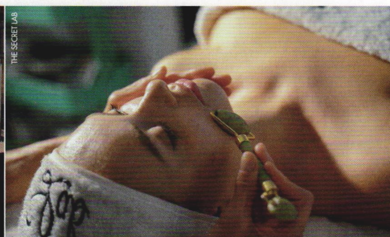
THE SECRET LAB