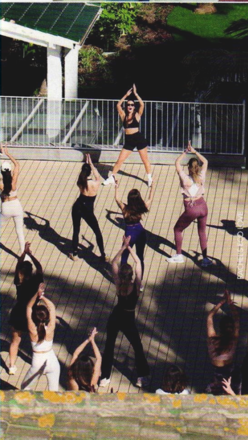
RACHEL'S ECO LOVE

Cada vez más grupos de amigas reservan centros boutique para una sesión de deporte personalizada y privada. En Barrelatte (c/Bretón de los Herreros, 26, Madrid) han visto cómo estos minieventos se han popularizado entre su clientela femenina. En esta sala especializada en barré ofrecen una clase privada, así como máscaras de luz infrarroja y una carta de cafés de especialidad, y la posibilidad de traer un catering para alargar la mañana con un brunch saludable. Para un plan más cañero está Síclo (paseo de La Habana, 26, Madrid), con sus sesiones de ciclismo indoor que pueden privatizarse y moldearse al gusto de la bride to be . En la costa malagueña, el grupo Rachel's Eco Love (N-340, km 176, 5, Marbella) propone una jornada personalizada que incluye una sesión deportiva al aire libre (pilates, yoga, funcional...) seguida por un desayuno healthy .