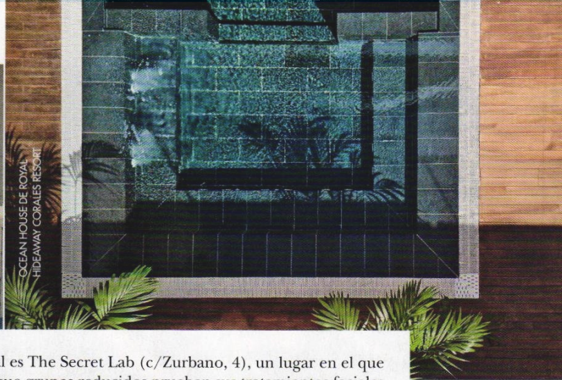
OCEAN HOUSE DE ROYAL HIDEAWAY CORALES RESORT

con amigas en la capital es The Secret Lab (c/Zurbano, 4), un lugar en el que organizan tardes para que grupos reducidos prueben sus tratamientos faciales y corporales, así como su amplísima variedad de manicuras y pedicuras.